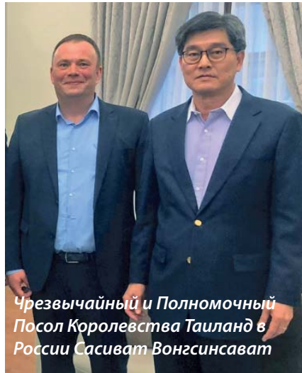
Чрезвычайный и Полномочный Посол Королевства Таиланд в России Сасиват Вонгсинсават

– Согласно уставу Ассоциации мы активно взаимодействуем с органами государственной власти различных уровней